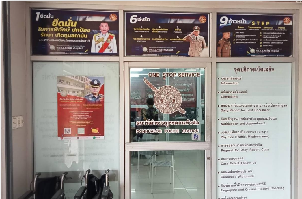
จัดทำช่องทางรับเรื่องร้องเรียนโดยตรงต่อ ผกก.๗ ติดตั้งป้ายไว้บริเวณห้อง บริการประชาชน(One Stop Service),